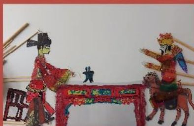
學生參照中式傳統風格，設計和製作皮影戲偶及道具

在籌備過程中，視藝科老師指導學生設計皮影戲偶角色、佈景和道具，及製作皮影戲偶包括：填色、剪裁和組裝等多個工序。此外，學生反覆排練劇目，務求演出力臻完美，即使排練期間遇上困難，大家同心合力，溝通解難。