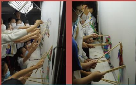
每一個皮影戲偶都裝有五支操縱桿，由兩位同學合作操控