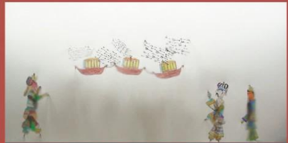
《三國演義》經典情節 - 草船借箭

總括而言，「三國·皮影」是一次很好的跨科學習歷程，同學們從認知、情感及實踐三個層面均提升對中華傳統文化及道德觀念的認識。