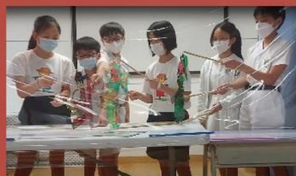
學生排練後反思如何優化演出